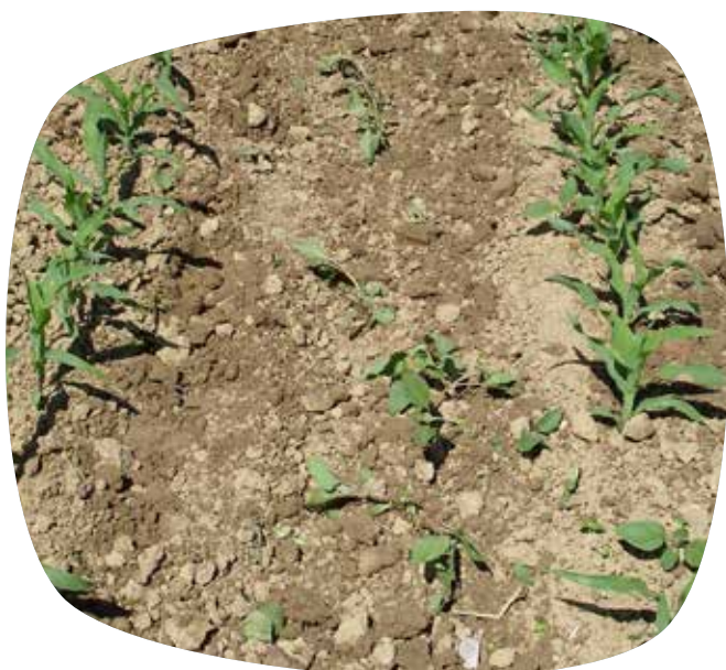
Effet du binage sur le xanthium : après