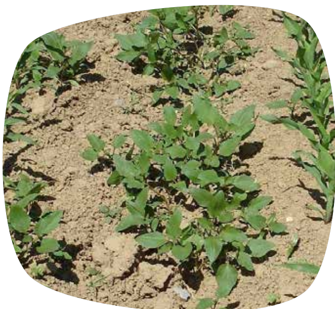
Effet du binage sur le xanthium : avant