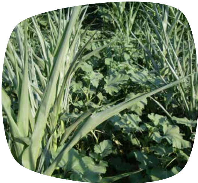
Pieds de xanthium dans du maïs