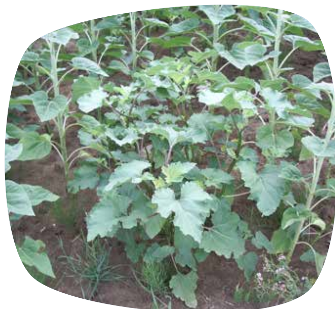
Xanthium dans du tournesol