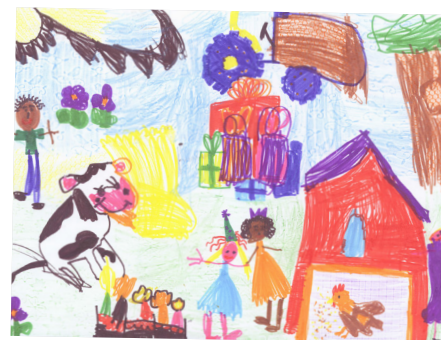
1 er prix, catégorie des 4-5 ans

> Contact : Valérie LOUCHEZ : 07 87 79 18 47