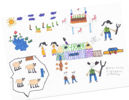
1 er prix, catégorie des 6-7 ans

Un taux de participation en nette progression : depuis son lancement, le succès du concours est fulgurant. 140 dessins collectés en 2015 contre 32 en 2014 ! Le concours est une occasion supplémentaire pour le réseau de faire parler de lui, de se faire connaître auprès du grand public et pour les adhérents, d'élargir leur clientèle.