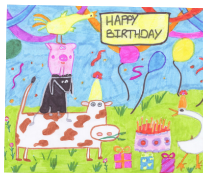
1 er prix, catégorie des 8-11 ans