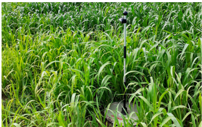
Millet implanté après un méteil fourrager (déchaumage + semis au combiné)

Après méteil fourrager : Dérobées estivales (moha/millet/sorgho/teff grass) ou maïs à indice précoce.