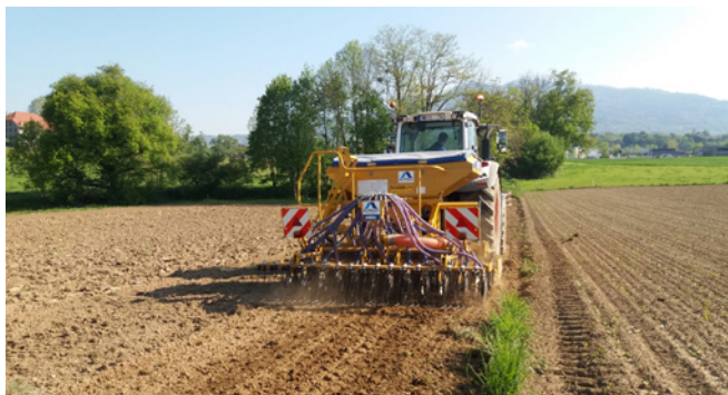
Implantation d'un méteil au semoir combiné.

Rappuyer le sol après le semis de la prairie (rouleau denté de préférence) pour favoriser le contact entre la graine et la terre.