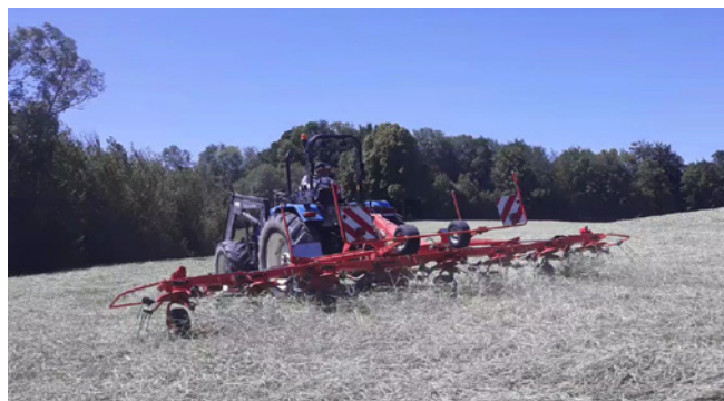
Fanage d'un méteil foin

Pâturage : Pâturage précoce possible sur l'automne si le méteil a été implanté tôt et si parcelle portante sans pénaliser rendement de l'année n+1 (Effet positif du pâturage précoce hivernal : tallage, nettoyage des potentiels adventices) + pâturage au printemps avant épiaison .