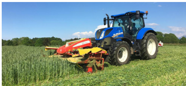
Fauche du méteil 18/05/2020, 3.75 t MS/ha

Fauche du méteil le 18/05/2020 stade début épiaison 3.75 t MS/ha