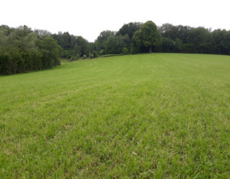
Méteil fourrager pour valoriser en foin

Fauche plus précoce l'année prochaine (avant épiaison) pour gagner en valeur. Cette fauche précoce pourra être mise en place grâce au déshumidificateur.