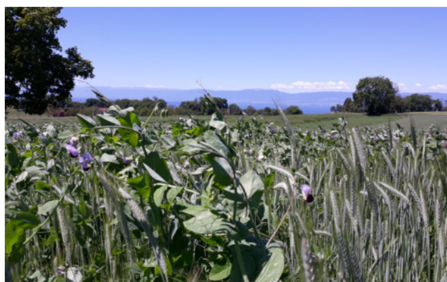
Méteil grain Triticale / Pois fourrager

Méteil grain : Mélanges les plus pratiqués en Savoie • Triticale 150 kg (Kortego, Cando, Bienvenu) + Pois fourrager 25 kg (variété Assas) • Triticale 115 kg + Avoine 40 kg + pois fourrager 25 kg • Triticale 90 kg + pois fourrager 15 kg + féverole 80 kg Objectif semis à 300 grains/m 2 (dont 20 à 30 grains/m 2 de protéagineux).