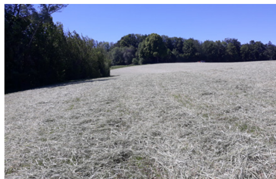
Prairie sous couvert après fauche du méteil