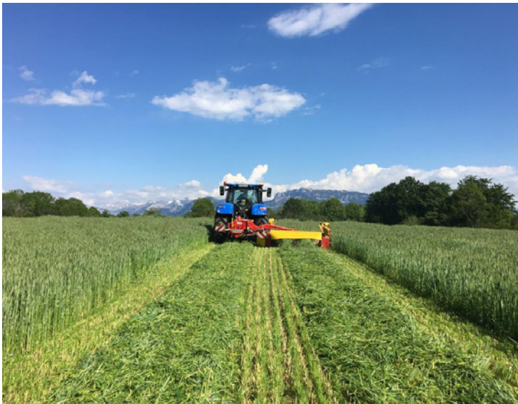
Figure 1 Fauche d'un méteil foin avec prairie sous couvert

La technique du semis sous couvert consiste à semer en simultanée une prairie d'automne avec un méteil (mélange céréale-protéagineux). Plusieurs avantages pour cette technique qui se démocratise