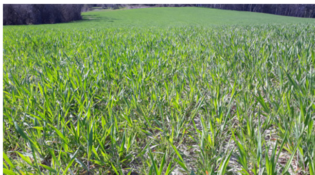
Méteil fourrager en sortie d'hiver (Triticale/avoine/Pois fourrager)

Fertilisation le 25/03/2020 - engrais binaire 0-8-12 – 300 kg/ha