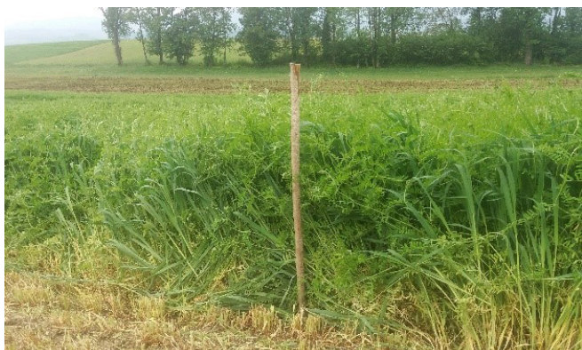
Mélange méteil affouragement Avoine/Vesce commune

Sur parcelle en rotation avec maïs ou céréales, plutôt privilégier de la vesce commune car plante moins agressive que la vesce velue.